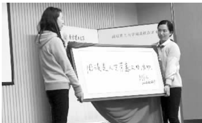
4月23日,南京理工大学在图书馆举行第十届读书节开幕式。2017年度国家最高科学技术奖获得者、南京理工大学教授王泽山亲笔题词“阅读是人生有意义的活动”,勉励大学生们多读书,提升自己综合素质。

除了家门口的“书房”外,对于居民来说,还有一个好消息,买书还有折扣。据悉,凤凰书城、先锋书店、大众书局、万象书坊4家鼓楼区的“最美书店”和区全民阅读活动领导小组签订了全民阅读共建协议,联手开启了为期三天的全场图书6.5折的文化惠民书市。