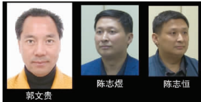
三名犯罪嫌疑人