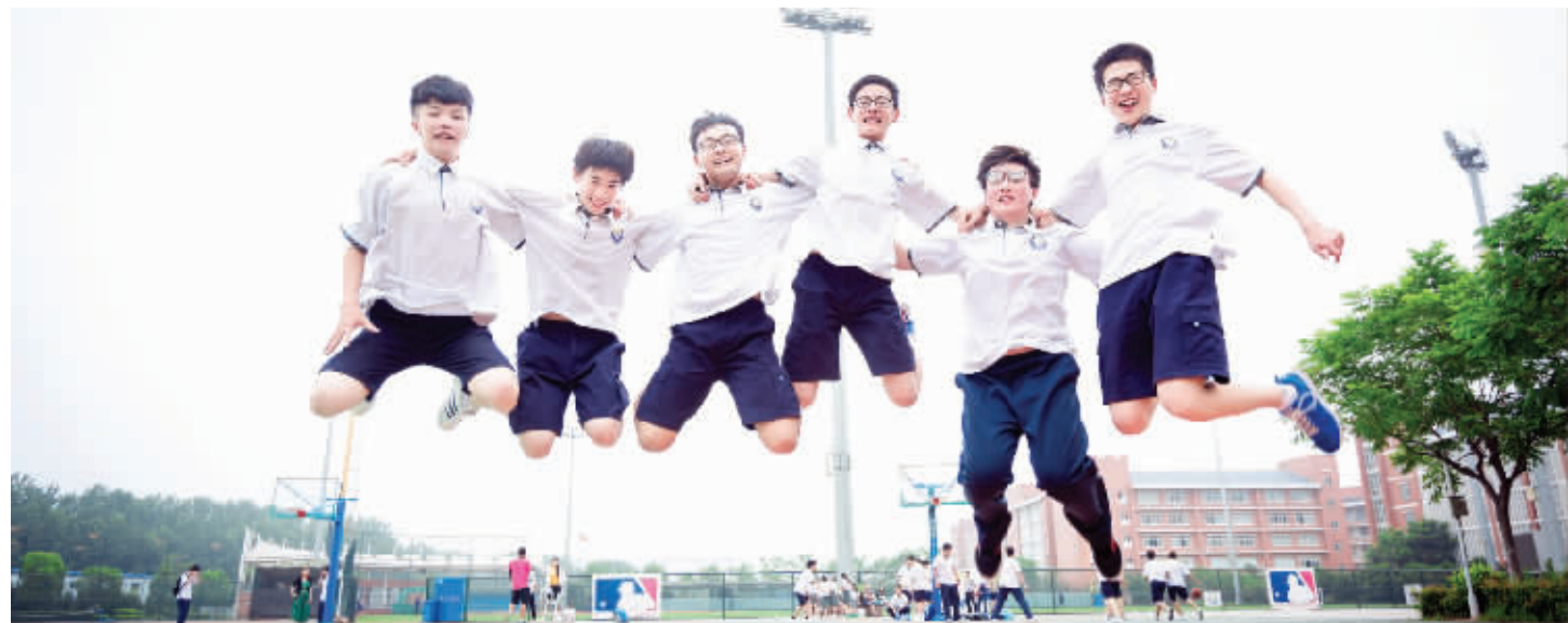
每个学生在东外都能够获得教育的温度