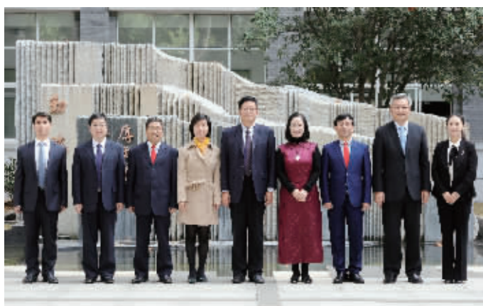
团结奋进的校领导班子

学校高度重视学生发展指导工作特别是心理健康教育工作。基于“生本理念”的教育需求,目