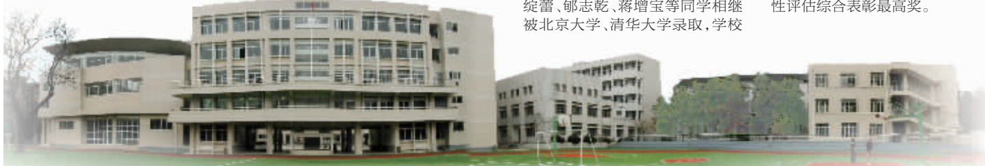
玄武高级中学校园

学校先后被评为南京市STEM试点校、全国排球传统学校、全国攀岩特色学校、全国德育先进学校、省心理示范学校。