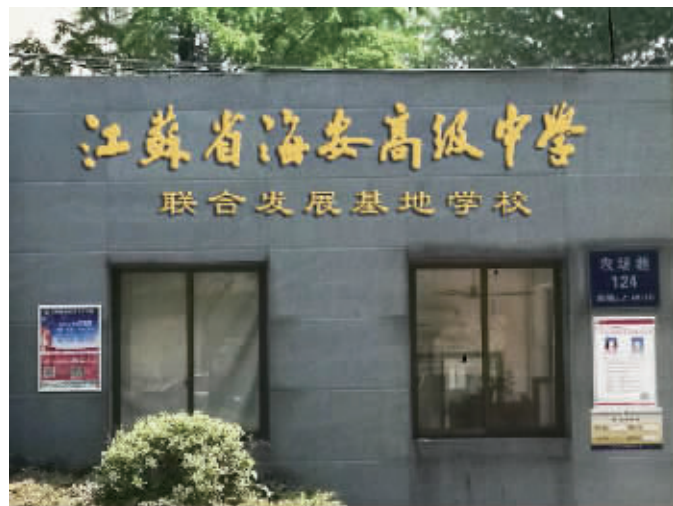
江苏省海安高级中学联合发展基地学校挂牌