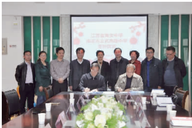
江苏海安中学与玄武高级中学签约