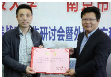
聘请南方科技大等高校教授为竞赛教练