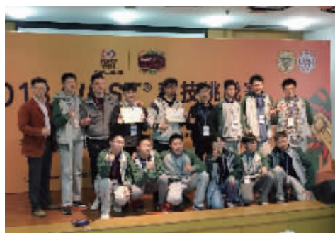
FTC科技挑战赛获“启迪奖”