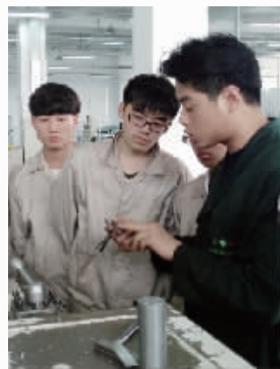
学生在舍弗勒培训中心学习

南京交通职业技术学院、南京旅游职业学院、南京信息职业技术学院、江苏农牧科技职业技术学院的合作,实施“3+3中高职分段培养”计划,加强在财会专业、汽车专业、物联网专业、电子与信息技术、园林技术等专业的实训基地建设、师资培养等方面的合作。