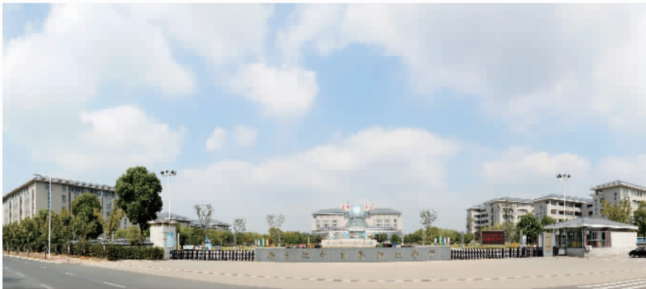
江宁高职校正大门