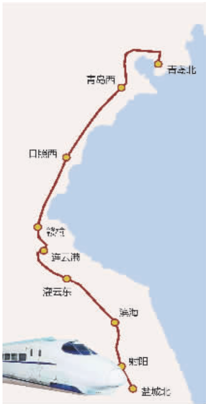
青盐线走向示意图 制图 李荣荣

不仅如此,现代快报记者了解到,徐宿淮盐铁路盐宁高铁联络线去年已开工,这也是盐城通往南京最快捷的高速通道,连淮扬镇铁路、徐宿淮盐铁路两条高铁建成通车后,可以通过该联络线开行盐城至南京的直达列车,盐城至南京的铁路行程将缩短到约1个半小时,再加上盐城到青岛的2小时45分钟,走这条沿海铁路,南京到青岛需要4小时15分钟左右。目前,南京到青岛的高铁最快要4小时57分钟,这样看来,走盐宁高铁、青盐高铁的话,南京去青岛能快至少40分钟。