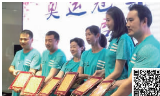
奥运冠军们