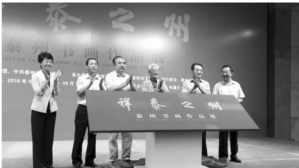
与会领导嘉宾共同为展览揭幕