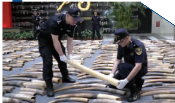
工作人员在整理查获的象牙