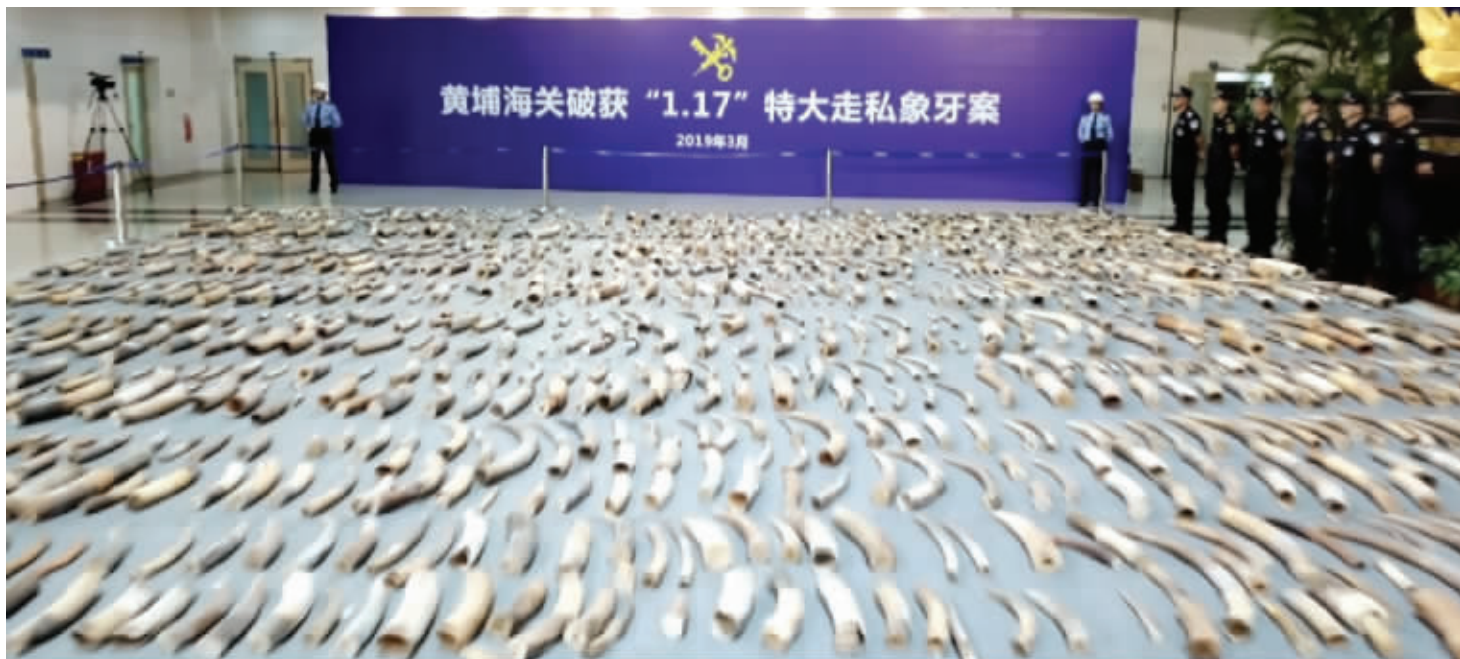
海关缉私部门查获的2748根象牙,铺满整个大厅