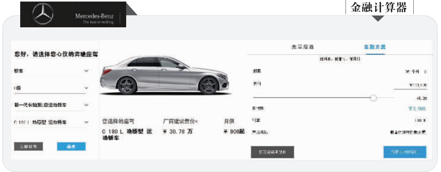
奔驰中国官网给出的车贷计算器,选择某款车型后,就有相应的月供和利率,如果不收取服务费,这个会有变化吗

银保监会表示,将根据调查情况依法采取必要的监管措施,切实维护金融消费者的合法权益。