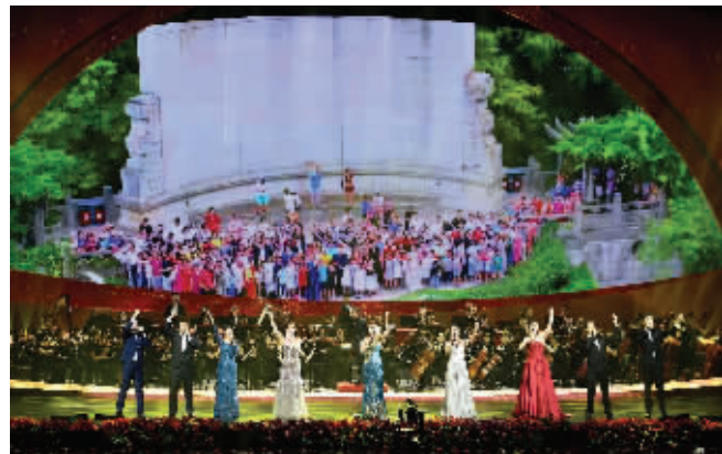
现代快报“iSING! 庆祝新中国成立70周年快闪”视频亮相演出现场