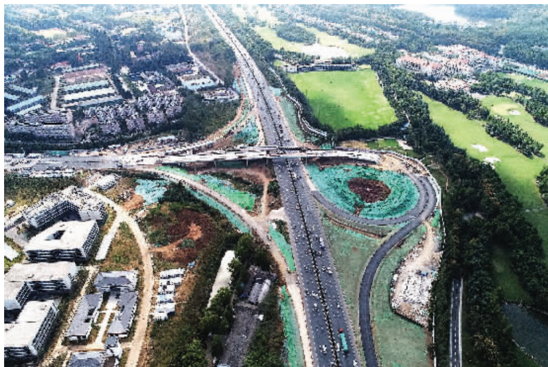
绕城公路徐庄互通

10月17日,现代快报记者在工程现场看到,在建的徐庄互通C匝道第二联左侧钢箱梁正在进行顶推作业,目前已接近完成。此前右侧钢箱梁在9月已经顶推完成。