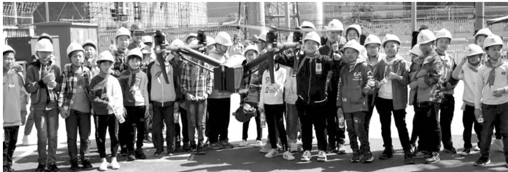
金坛罗村小学参加“电力探秘看常州”游学

“敬爱的叔叔、阿姨，感谢你们的帮助，让我们去外面看看，去外面学习更多知识。”“我一定会发愤图强、好好学习的，感谢您们！”“我会比以前更加努力学习。”……10月15日，常州供电公司金坛区薛埠镇罗村小学的六年级学生们举办了一场“电力探秘看常州”游学活动，事后，志愿者们纷纷收到了学生亲手制作的贺卡和祝福。