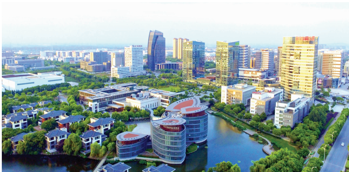
高质量发展中的惠山经济开发区