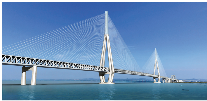
常泰长江大桥效果图

常泰长江大桥东距江阴长江公路大桥约30.2公里，西距泰州长江大桥约28.5公里，南北连接常州和泰州两市，路线全程10.09公里。