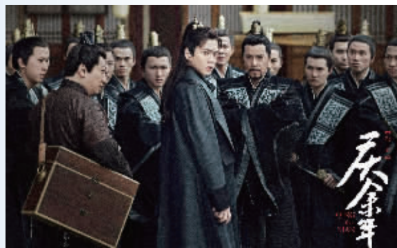
《庆余年》剧照

腾讯、爱奇艺针对《庆余年》推出的二次付费模式惹了众怒,甚至有网友过激表示“宁愿看盗版”。就想问一句:一句招呼不打就高高在上地推出VVIP待遇,是谁给他们的勇气?