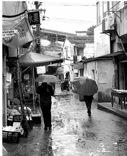
黄家圩住宅区

“2019年12月30日凌晨4时许，我辖区黄家圩某居民楼门前晾衣杆上一块咸猪肉被一名中年妇女所盗。被盗咸猪肉系居民药老鼠所用，上面涂有老鼠药。望盗窃咸猪肉中年妇女看到告示后，主动联系红山派出所……”