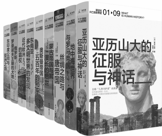
理想国·北京日报出版社 2020.1 「日」森谷公俊等 《兴亡的世界史(首辑九卷)》

史的主角,游牧骑马民族之动向,并且努力探讨丝绸之路这条大动脉,从大局上来把握唐帝国的本质。本书的叙述主线有三条:与丝绸之路的历史表里一体的粟特人的东方发展史;唐朝的建国史与唐朝建国前后突厥的动向;由安史之乱而带来的唐朝的变貌以及回鹘的活动。