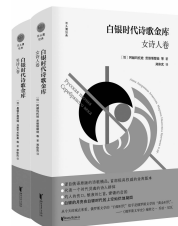
2020年1月 浙江文艺出版社 郑体武译 《白银时代诗歌金库》

十则故事,十种不同的隐秘、伤口和冒险。这些故事大多发生在古典的苏州和摩登的上海,朱文颖以沉静冷峻的笔调,描写了一个生机勃勃而又哀婉凄凉的南方。在这些南方故事中,有爱情中的相守与疲惫,有女性之间的友谊与计较,有欲望的升腾与破灭,也有突如其来的死亡和绵长的忧愁……朱文颖以女性特有的敏感、细腻观察着人在情感世界中所遭受的痛苦、伤害和隐藏于其后的欲望与虚无,书写了中国都市女性在现实世界中关于情感、物质与自我的思考,揭示了繁华表象背后的人性命运。