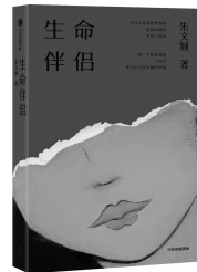
2020年1月 中信出版·大方 朱文颖 《生命伴侣》

十则故事,十种不同的隐秘、伤口和冒险。这些故事大多发生在古典的苏州和摩登的上海,朱文颖以沉静冷峻的笔调,描写了一个生机勃勃而又哀婉凄凉的南方。在这些南方故事中,有爱情中的相守与疲惫,有女性之间的友谊与计较,有欲望的升腾与破灭,也有突如其来的死亡和绵长的忧愁……朱文颖以女性特有的敏感、细腻观察着人在情感世界中所遭受的痛苦、伤害和隐藏于其后的欲望与虚无,书写了中国都市女性在现实世界中关于情感、物质与自我的思考,揭示了繁华表象背后的人性命运。