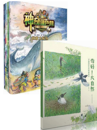
《神奇绿色营》《你好!大自然》封面

快报讯(记者 郑文静)1月9日上午,由凤凰出版传媒集团、江苏凤凰科学技术出版社主办的“中国原创生态童话《神奇绿色营》《你好!大自然》新书发布”在