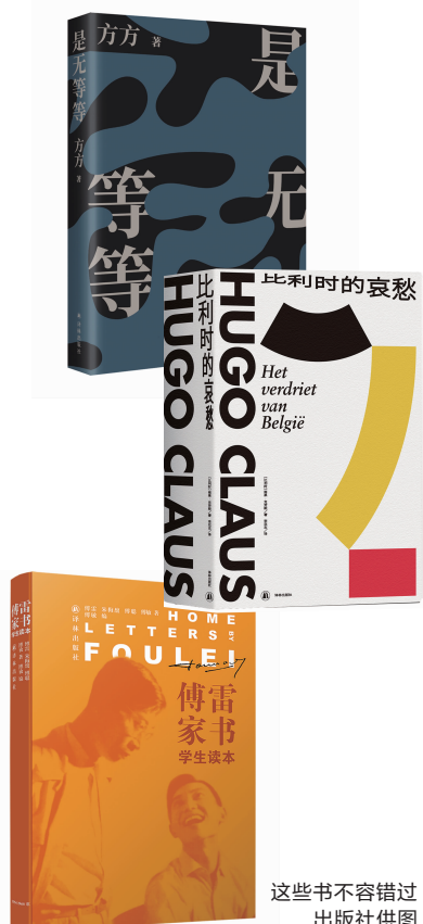
这些书不容错过

备受关注的“2020年译林重点新书”也随之揭晓,包括《傅雷家书:学生读本》《第三帝国的兴亡》《丘成桐自传》《万有引力之虹》《比利时的哀愁》《马可瓦尔多》《是无等等》《小妇人》《牛津通识读本》《新药的故事2》。