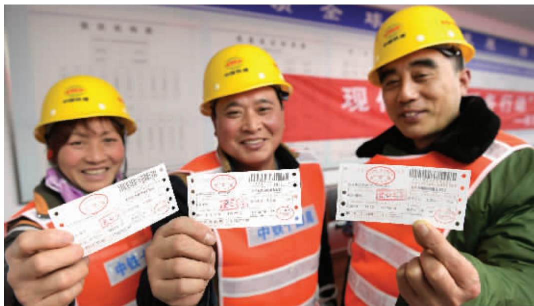
工友们拿到回家过年的爱心车票