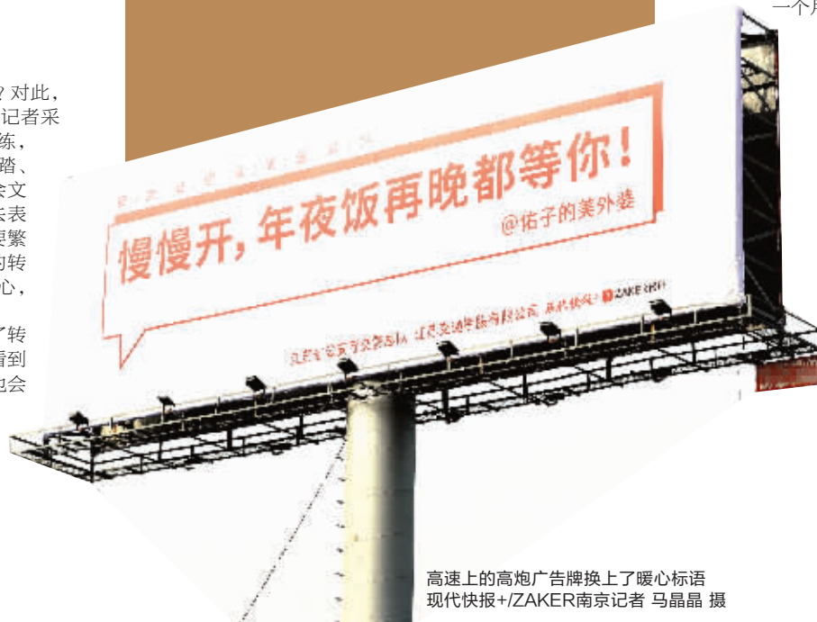
高速上的高炮广告牌换上了暖心标语