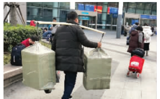
陈奶奶在前面拖着行李,老伴挑起两大袋土特产走向候车室