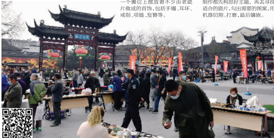
众多古玩收藏爱好者在赏宝淘宝