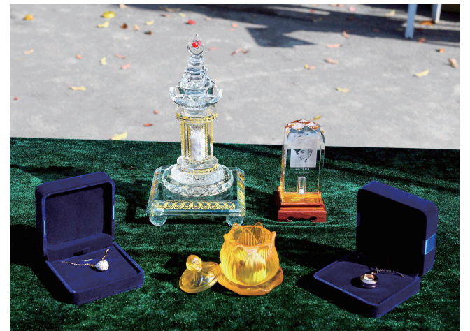
“生命晶玉”放在不同的载体里,方便亲友纪念

据雨花功德园艺术策划总监朱建华介绍,“生命晶玉”的成功推出,在当前土地稀缺的刚性制约下,具有重要的意义。现代快报记者了解到,在推进节地生态葬方面,南京频出实质性举措。越来越多的市民选择节地生态安葬方式,绿色殡葬逐渐深入人心。比如南京雨花功德园已经推出树葬、花坛葬、音乐水葬、墙壁葬等多种节地葬式。“生命晶玉”生态葬可以为市民提供更大的选择空间。