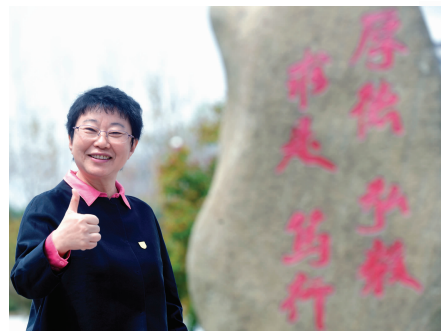
南京邮电大学校长叶美兰