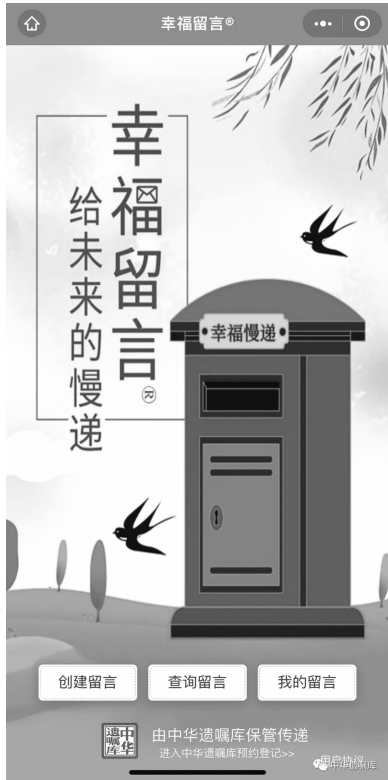
情感遗嘱留言页面