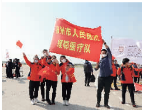
4月12日，南京禄口国际机场，泰州市人民医院援湖北医疗队队员回到江苏