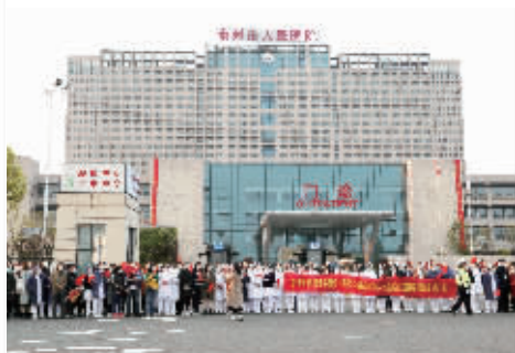
4月12日，泰州市人民医院总院院区南门，社会各界欢迎医护人员归来