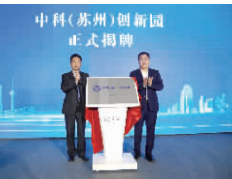
疫情防控和经济发展两手抓，中科(苏州)创新园揭牌 本版图片均由太平街道提供