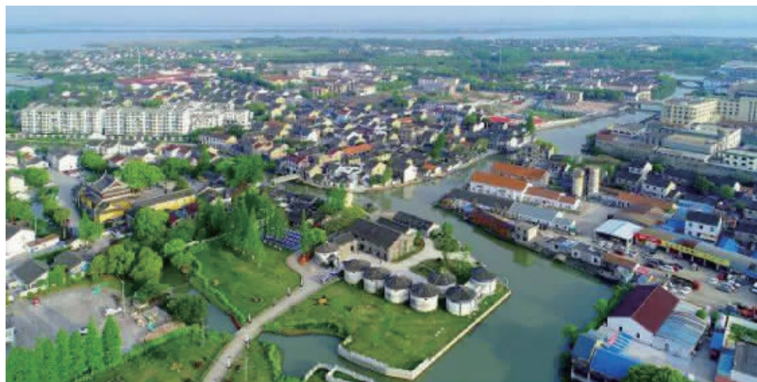
江南荻溪,盛世太平