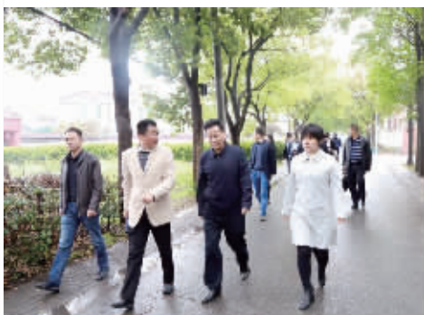
打好疫情防控“统筹牌”，召开农村人居环境现场会