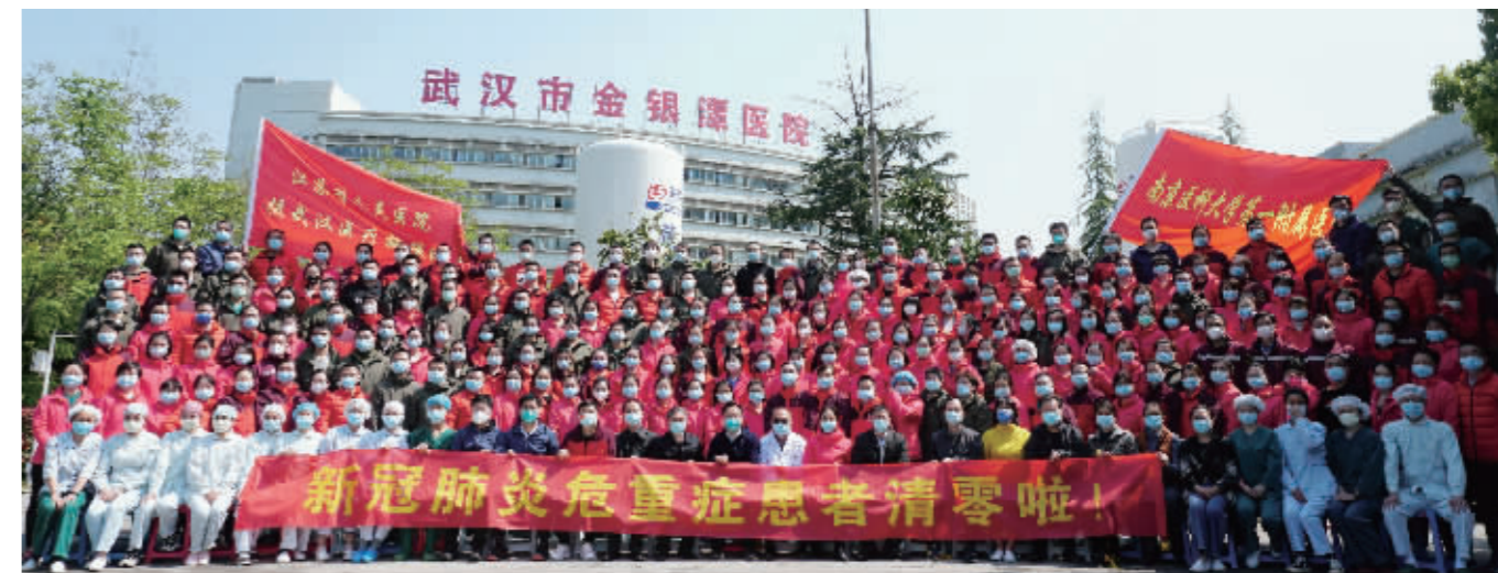
江苏医疗队进驻金银潭20天,实现新冠肺炎危重症患者清零

目前,还有20名医护人员组成的国家专家督导组继续留守武汉,江苏有10人入选。他们将攻坚最后的“重症堡垒”。