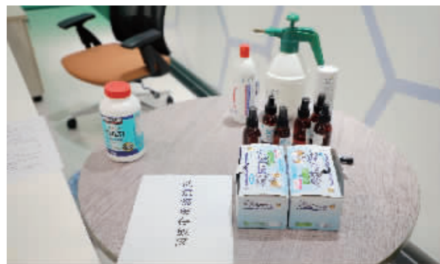
① ② ③ ④ ⑤ ⑥ ⑦