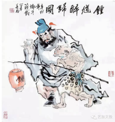
耿善昌《钟馗醉归图》