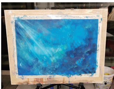
小玉儿的作品“天空海洋”

小男孩拿着画笔,在一块跟自己差不多高的画板上画画,看上去像是随意涂鸦,仔细看看就会发现并不是这么简单。近日,这样一段视频在网上火了,有网友表示自己从画中看出了穿白大褂的医生,也有网友认为画的是救火的消防员,还有网友表示,“感觉那么多年美术白学了。”