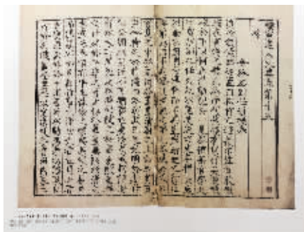
南京图书馆藏“蝴蝶装”《蟠室老人文集》