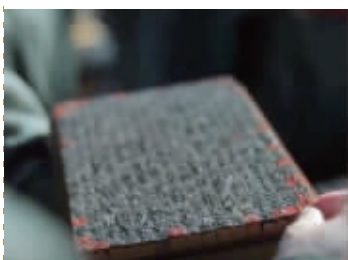
电视剧《清平乐》中的胶泥活字(截图)