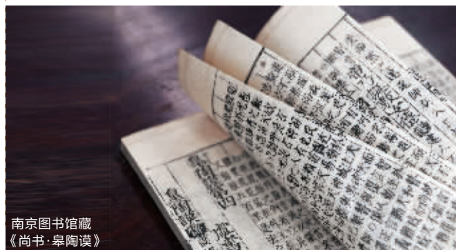
南京图书馆藏《尚书·皋陶谟》

十三经,是十三部儒家经典,《尚书》是其中之一。《尚书·皋陶谟》记录了舜帝君臣之间谋议国事。皋陶是舜帝的大臣,掌管刑法狱讼。这本书,很适合仁宗的人设和气质了。