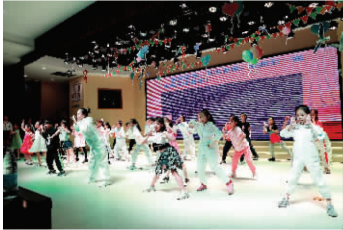
▶329名毕业生人人都是演员