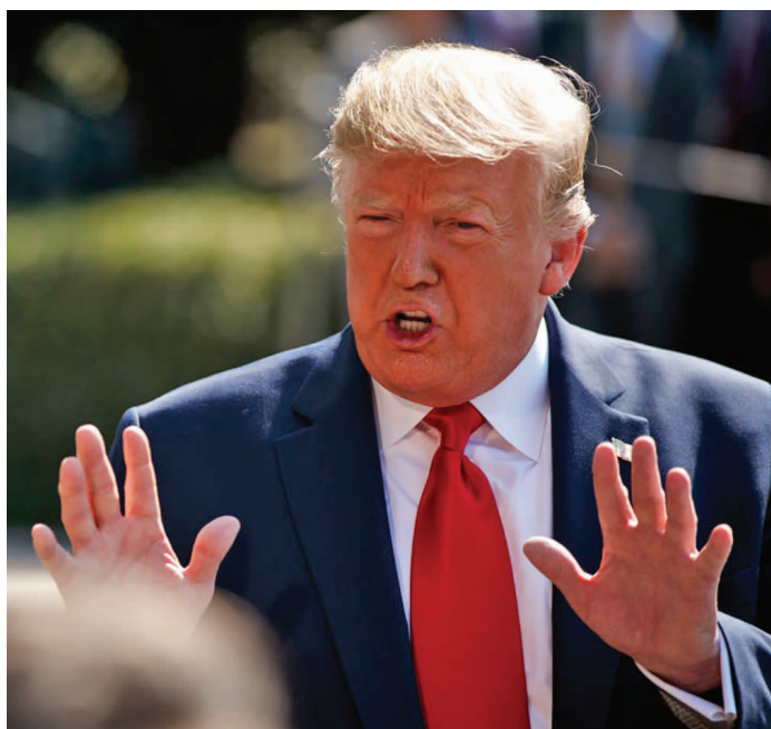
美国前总统特朗普 新华社发