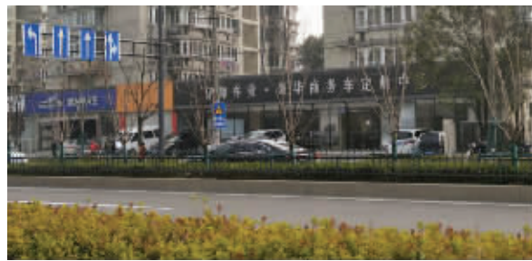
南京亿海汽车销售服务有限公司