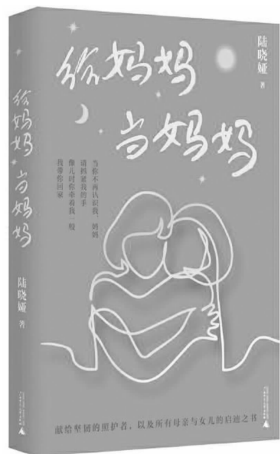
2021年11月 广西师范大学出版社 《给妈妈当妈妈》 陆晓娅

据我国疾病预防控制中心的统计,目前我国阿尔茨海默症患者的人数约1000万,预计2050年将超过4000万。患病率随着年龄而显著增加,65岁以上的平均发病率是5.2%,75~85岁的平均发病率是15%~20%,85岁以上的老年人平均发病率达到了30%左右。阿尔茨海默症的基本病理变化,是大脑皮质的神经细胞逐渐退化,并且数量大量减少,这些神经细胞与人类的记忆、学习和判断能力紧密相关,一旦患上这个疾病,病人就会逐渐丧失记忆和其他认知,以目前的研究来说,这个过程是不可逆的。所以,在《给妈妈当妈妈》书里,这个病采用了更直观的“认知症”的叫法。该书作者陆晓娅当过多年记者,后来又从事心理工作,但这本书并不是学术性的讨论,它是以短章形式展现的生活随