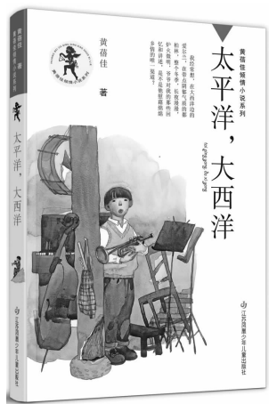
2021年3月 江苏凤凰少儿出版社 《太平洋,大西洋》 黄蓓佳

听同事钟小羽说,黄蓓佳大姐又将推出一部新的长篇小说,大致可以看作《野蜂飞舞》的姊妹篇。我连忙问她,书名叫什么?她答《太平洋,大西洋》。如此宏阔浩大的题目?我立刻想到的是王安忆的《伤心太平洋》。王安忆这部小说,不同于《纪实与虚构》多写他的母系家族,而是写他的父亲一脉,很见功夫。王安忆这样说道:那时候,父亲是个十九岁的少年,他热心于戏剧和救亡,他跟随歌剧团从新加坡出发,贯穿了马来亚,最后去往檳城,一路唱着抗日的歌曲。那也是七八月的南季候风的日子,热带的阳光把他晒得焦黑。我眼前出现了一个身穿短裤、皮肤焦黑的少年,随着这少年的出现,我心中突兀而起一股伤痛之感。这伤痛之感从浩荡的海面陡然升起,弥漫,渗透,阳光也变得彻心的伤痛。但黄蓓佳的《太平洋,大西洋》又会给我们讲述怎样的故事呢?是家族往事?是海外华裔?是学子留学?急不可待,找来初读,大出意外。依旧深情款款,依旧收放自如,但不同的是,复调的结构,时空的交错,今昔的对比,令人倍感作者驾驭此类