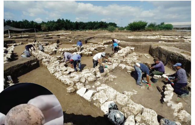
▲以色列中部一考古现场