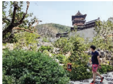
游客打卡江苏园博园