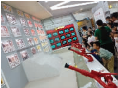
孩子们在龙之谷体验当消防员