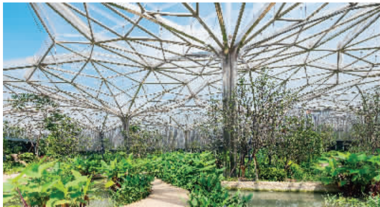
江苏园博园水下植物园