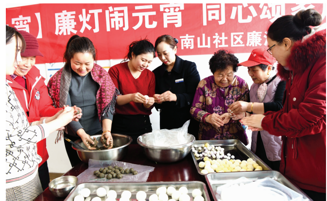
元宵节前,连云港墟沟街道南山社区和江苏银行连云港营业部联合开展“迎元宵佳节情暖环卫工”活动,组织党员干部和志愿者一起包元宵送给环卫工,送上节日的祝福。