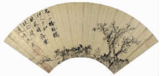
沈周 秋林图扇页 故宫博物院藏