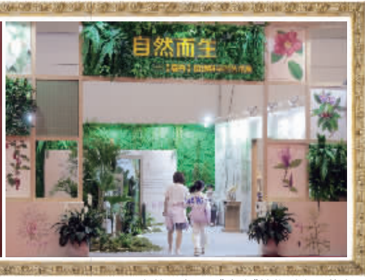
自然而生——《嘉卉》植物科学画艺术展

策展人告诉现代快报记者，推出这个展览，意在尝试着做一次全新艺术实验性展陈，“我们可能很少有机会在显微镜下仔细观察植物的局部形态，但是中国顶级的植物插画师用画笔绘出了栩栩如生、精细入微的植物肖像。通过展览，我们希望传递对自然的关注，对艺术多元化的理解，对阅读方式的全新认识。”