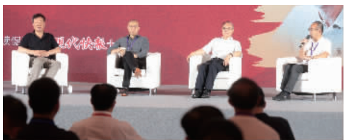
“书香中国·全民阅读大讲堂”活动现场

而时代的命运也随之改变。”毕飞宇说，台上四个人都有着相似的乡村童年经历，正是因为热爱读书，四个“乡下放牛娃”才拥有了改变命运的机会。“读书，能够选择自己想要的生活和人生；不读书，你的人生就是被选择的人生，是如同工具一样被选择的人生。工具有价值，但并不是鲜活而伟大的生命。”毕飞宇认为，阅读的意义还在于让人学会理解和表达。