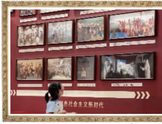
“谱历史华章，为人民画像”美术作品展

展览按照新民主主义革命时期、社会主义革命和建设时期、改革开放和社会主义现代化建设时期、中国特色社会主义新时代分为四个单元，展出的作品有《三大主力会师》《焦裕禄》《小岗》《青藏铁路》等，都是大众熟悉的军事、历史、人物题材，看上去倍感亲切。杂交水稻之父袁隆平的画像也在展出之列。