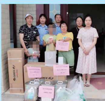
热心市民捐赠了空调等物品