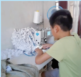
13岁的大儿子常帮着妈妈干活