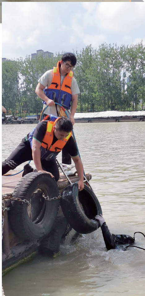
将打捞上来的轮胎皮递给岸上队员