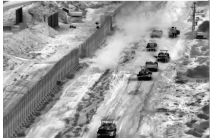
这张从以色列国防军发布的视频中截取的照片显示，10月26日，以军在加沙地带北部开展行动

巴以新一轮冲突26日进入第20天。以色列持续空袭加沙地带造成大量人员伤亡，以军地面部队也在加沙地带北部开展行动，对巴勒斯坦伊斯兰抵抗运动（哈马斯）的部分军事目标、基础设施和反坦克导弹发射站发动了袭击。短暂突入加沙后，以军撤出。此举是为下一阶段的军事行动做好准备。迄今只有少量援助物资获准运入，加沙地带食品、燃油和医疗物资严重短缺，人道主义灾难日益严重。