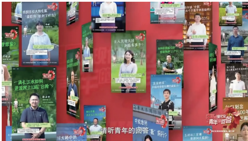
“中国式现代化·青年的回答——我比任何时候更懂你(第三季)”先导片 视频截图

以青春之问,叩响未来之门;以青年之答,回应世界聚焦。10月25日,“中国式现代化·青年的回答——我比任何时候更懂你(第三季)”先导片,燃情来袭。