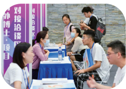
海内外博士项目对接会现场

四是激活改革开放“源动力”。深入推进要素市场化配置、科技人才评价、科技体制等重点领域改革，加快国家科创金融改革试验区、知识产权保护示范区建设，持续优化营商环境政策体系。全面融入和服务长江经济带发展和长三角一体化发展战略，放大“自贸试验区+服务业扩大开放”叠加优势。