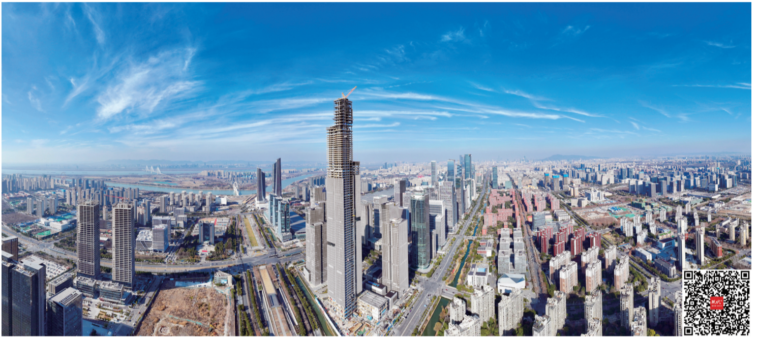
河西金融城二期(扫码看视频)