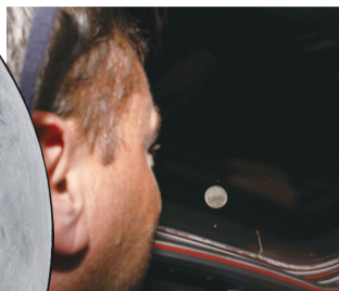
4月6日，美国航空航天局宇航员里德·怀斯曼从“猎户座”飞船上观看月球 新华社发