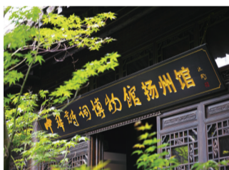
中华诗词博物馆扬州馆开馆

中华诗词博物馆扬州馆日前 开馆。该馆位于广陵路钱业会馆, 目前有“广陵春”“扬州慢”“望海 潮”“梦江南”四个展厅,建筑面积 近1000平方米。中华诗词学会常 务副会长林峰、秘书长杭中华、江 苏省诗词协会子川等参加了揭牌 仪式。